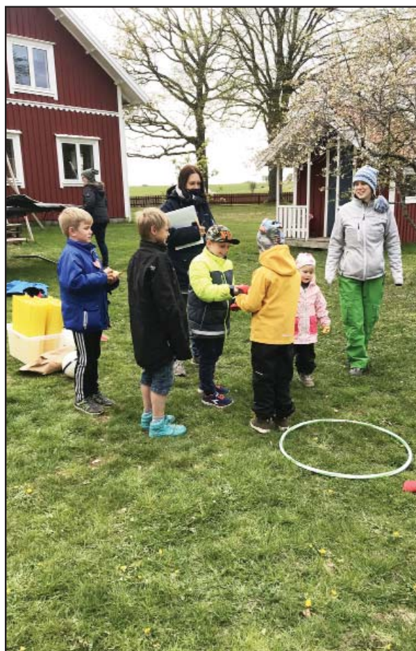
Terminsavslutning i Kompis